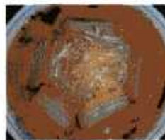
ネギ味噌チャーシュー麺