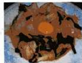
肉と野菜のタレヤキ