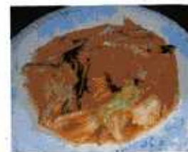
三枚肉とキャベツの辛炒め